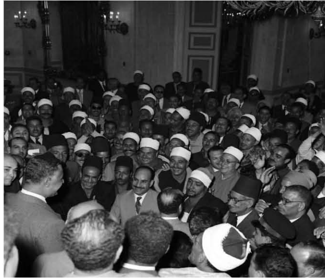
استقبال وفد من أهالى أسيوط بالقصر الجمهورى بالقبة ١٩٥٨/١١/٢٦